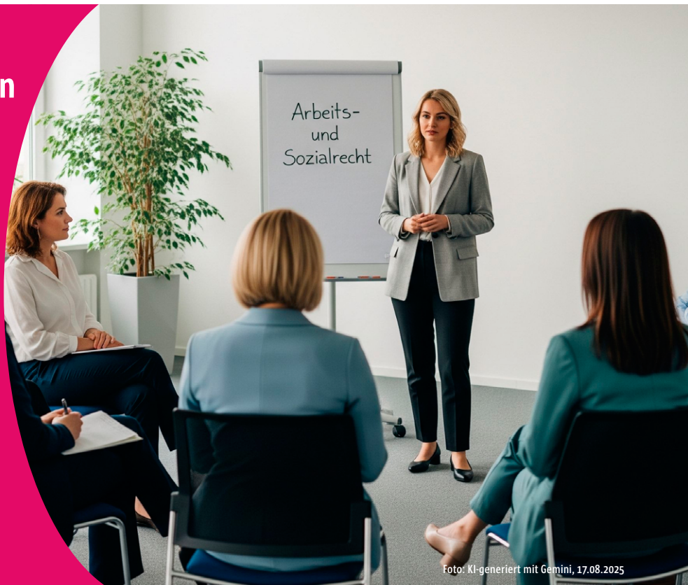
Foto: KI-generiert mit Gemini, 17.08.2025

19. bis 20. Juni 2026 23. bis 24. Oktober 2026