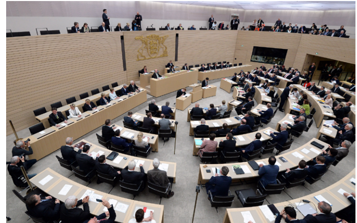
Landtag von Baden-Württemberg, Bilderservice, Landtag-Plenarsitzung

www.kab-drs.de oder KAB@blh.drs.de oder Tel. 0711 9791-4640