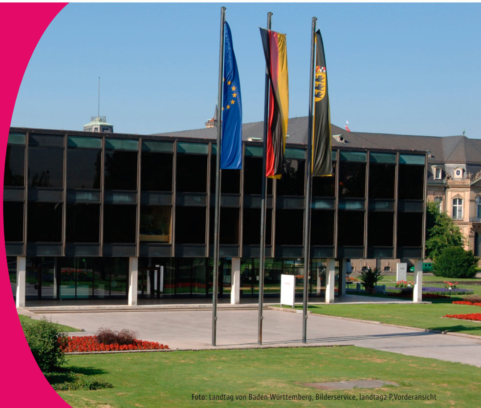
Foto: Landtag von Baden-Württemberg, Bilderservice, landtag2-P,Vorderansicht

Veranstaltungen zur Landtagswahl 2026 in Baden-Württemberg